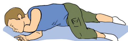
Устойчивое боковое положение